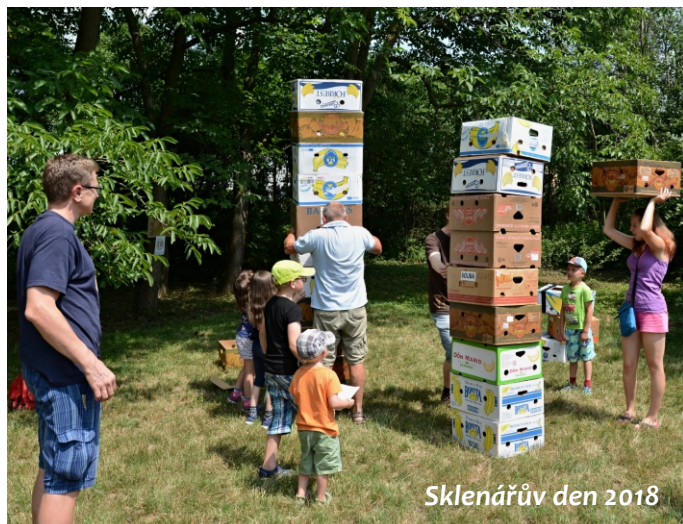
Sklenářův den 2018

Už teď se těšíme na 3. Sklenářův den , který se uskuteční v neděli 16. června 2019 od 13 do 18 hod. , a na který Vás i Vaše děti tímto srdečně zveme ☺.