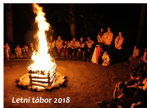
Letní tábor 2018

i řadu výletů. Na jaře jsme pak zorganizovali velkou hru po městě pro rodiče s dětmi zvanou Sorient'ák a změřili své síly na velkých závodech pro mladší děti. Některé naše soutěžní družiny se dostaly dokonce do krajského kola. Tradičním vyvrcholením roku byly ale opět čtrnáctidenní tábory. Podzim byl pak ve znamení 100 let republiky. Začátek zimy jsme odstartovali Mikulášskou divadelní besídkou pro rodiče či návštěvou Mikuláše v kutnohorské nemocnici. 23. prosince jsme se pak již tradičně sešli na Palackého náměstí a rozdávali Betlémské světlo. Tam se opět podařilo vytvořit krásnou atmosféru a společně tak zahájit Vánoce.