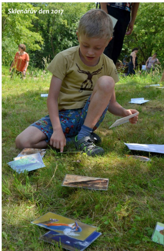
Sklenářův den 2017

https://www.jirkont.cz/kutna-hora-prace-venku/ Děkujeme firmě Jirkont za zveřejnění této informace.