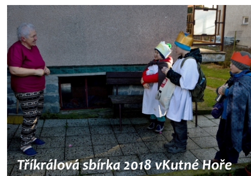
Tříkrálová sbírka 2018 v Kutné Hoře

V roce 2018 se nám podařilo doplnit pracovní kolektivy jednotlivých středisek o nové pracovníky, z toho máme opravdu radost. Velmi se vydařila Tříkrálová sbírka roku 2018 i 2019, sbírka je již tradiční součástí začátku nového roku a každým rokem přispívá mnoho štědrých dárců. Všem dárcům a koledníkům moc děkujeme. V červnu 2018 jsme zahájili rekonstrukci domu v Poděbradově ulici čp.289 (pod klášterem Voršilek), kde budou poskytovány tři sociální služby - sociální rehabilitace, sociálně terapeutická dílna, aktivizační služby pro zdravotně postižené a seniory. Náklady rekonstrukce z větší části hradí Evropská unie. Jsme rádi, že budeme ve vlastním objektu, navíc nově opraveném. Pro všechny klienty, kterým pomáháme, je to velká jistota do budoucna.