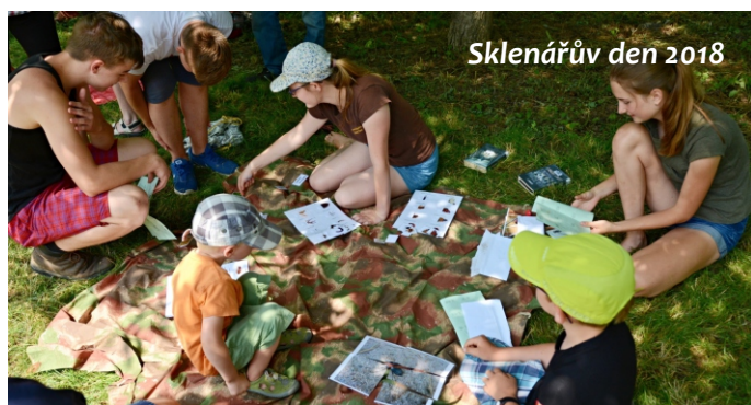
Sklenářův den 2018

Na webových stránkách firmy Jirkont.cz jsme našli zajímavou informaci. Sklenářův dolík se umístil na 2. místě průzkumu firmy „10 + 1 míst pro práci v přírodě v Kutné Hoře”.