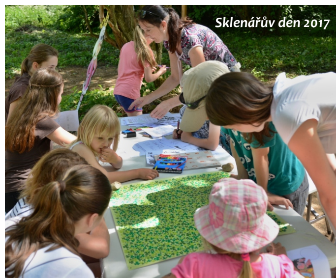
Sklenářův den 2017